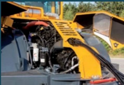
Gute Zugänglichkeit zu allen Wartungsstellen durch patentiertes Haubensystem.