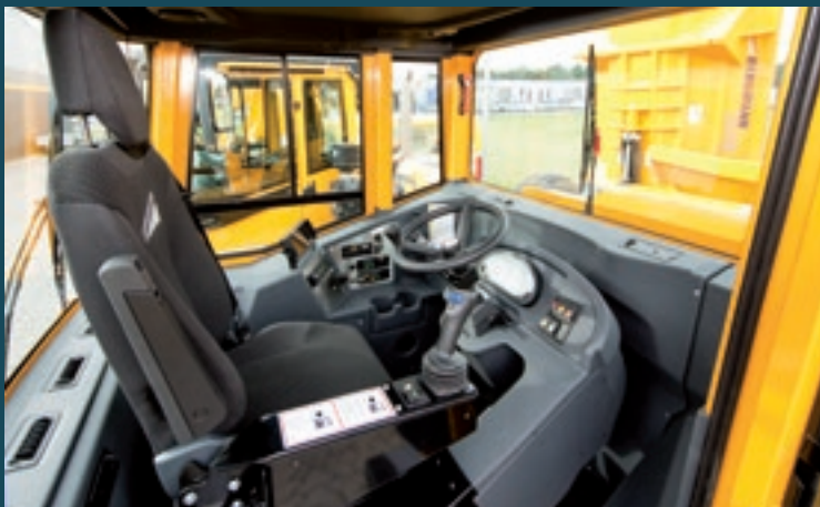
Kabine mit Drehsitz und intuitiver Bedienung.