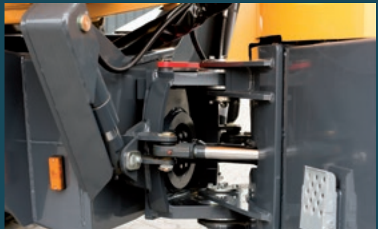
Knick-Pendelgelenk mit Stabilisierungszylinder.